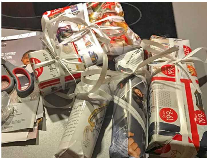
Eksempel på miljøvennlig innpakning.

Gavepapir og bånd kan ikke resirkuleres men må kastes som restavfall. Pakker du dine julegaver i brukt gavepapir, eller papir som kan resirkuleres, gir du også en gave til miljøet.